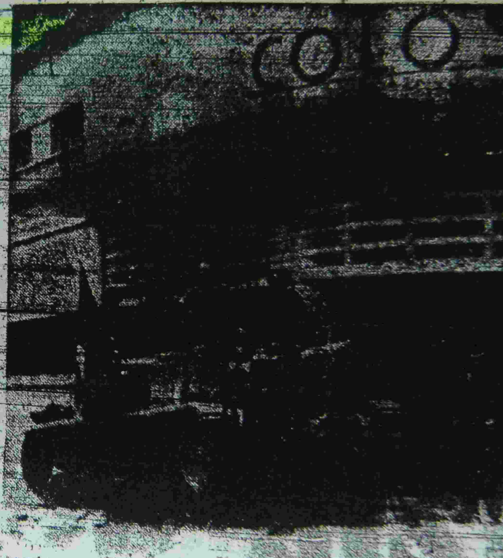
Carro armato catturato ai fascisti in via Madama C...