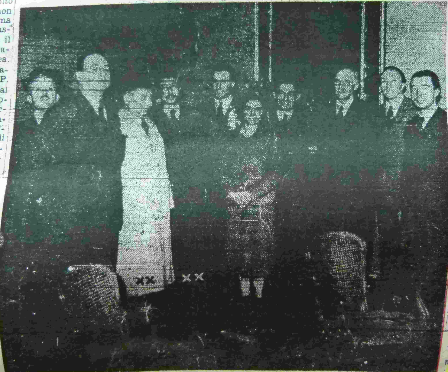
Il Prefetto della Provincia, PASSONI con alla destra il Sindaco di Torino ROVEDA durante la cerimonia dell'insediamento