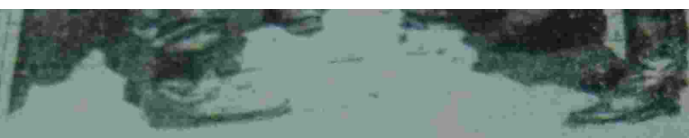
Ufficiali britannici affiancati da un ufficiale partigiano. Hanno trattato ieri, a Caluso, la resa di superstiti forze tedesche.